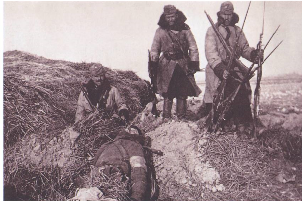
Indsamling af våben Østrig-ungarsk infanteri samler våben sammen i en erobret skyttegrav. Rus- serne manglede stærkt ge- værer og havde bestemt ikke råd til at miste dem til fjenden.

Elvte Armé at nærme sig floden dens udgangspunkt. To dage senere sikke Ottende Armé at romme sine arpaterne for at undgå at blive fan- den 11. var hele den russiske front ilbagetog. Modangreb mellem den standsede tysk-østrigske styrker , men i anden halvdel af maj var tablere sig øst for San. reorganiseringsperiode genoptog de ker offensiven den 12. juni, og den igennem russiske Tredje og Otten-