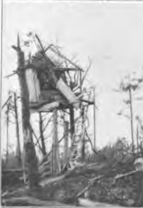
Der zerstörte Michelsstand. (Champagne.)