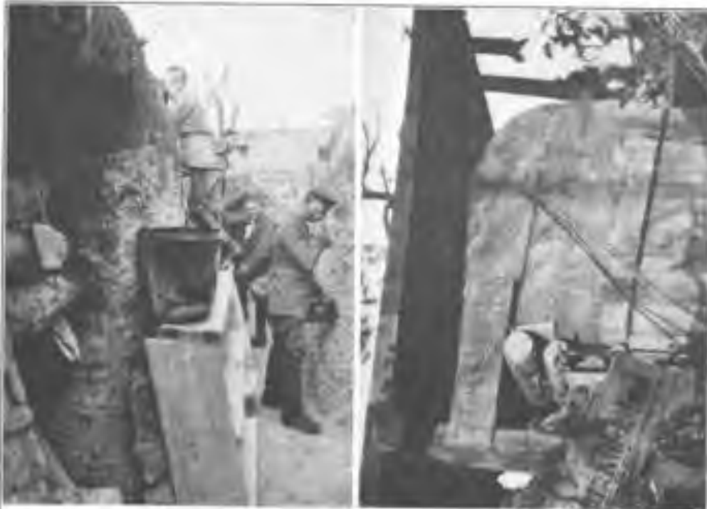
Der Stuchfand. Betonierte Beobachtungsstelle in der Champagne.