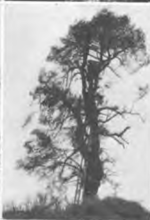
Der Lejtusbaum. (Reyon.)