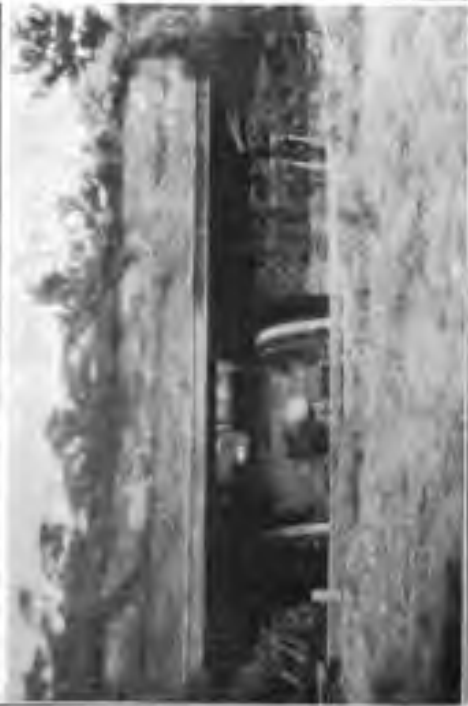
Betonierter Gefchüßfund in der Champagne vor