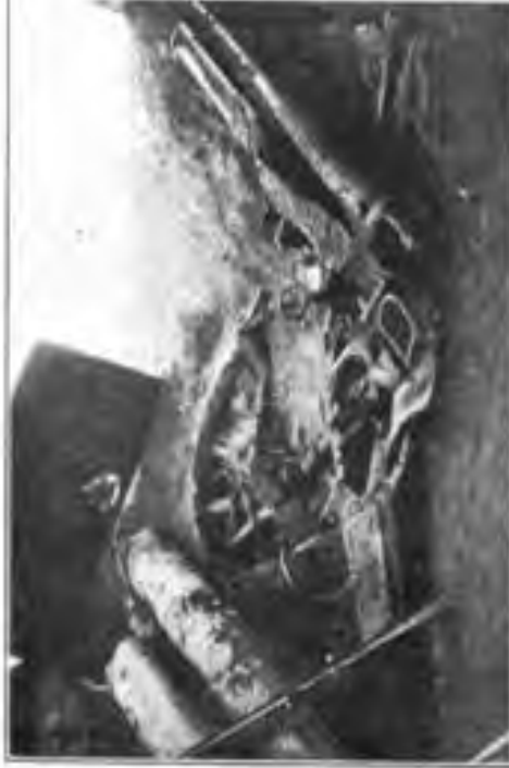
5./24 in der Stellung an der Schansee nördl. Pont les Brics nach der Befestigung.