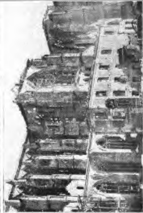
Kathedrale von St. Quentini im Frühjahr 1918.