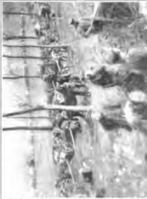
Stumpf bei Quiffancourt.