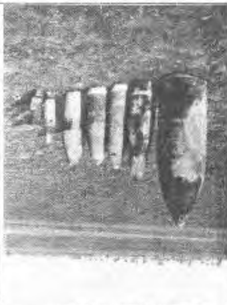
Abgeschossene französische Artilleriegeschosse von 7,5 bis 28 cm Kaliber.