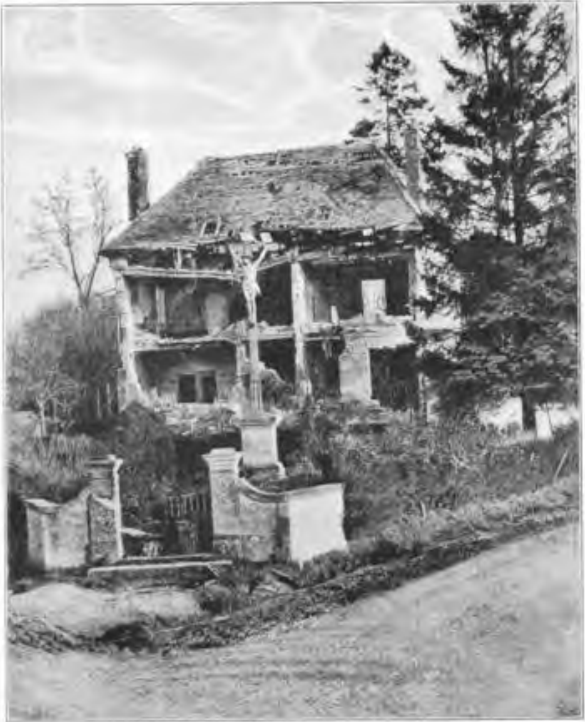
Das von Granaten zerstörte Haus mit dem unzerstörten Kreuzifix davor an der Chausseegabel in la Pommeroye bei Reyon.