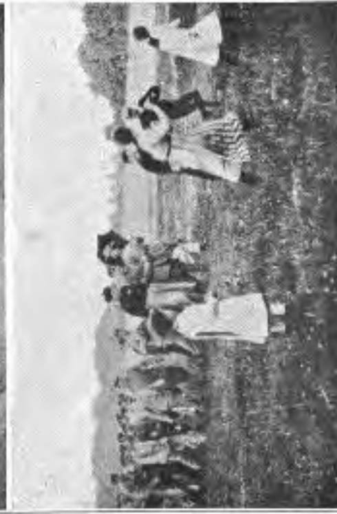
Batteriefeste während der Ruhezeit im Juni 1916.