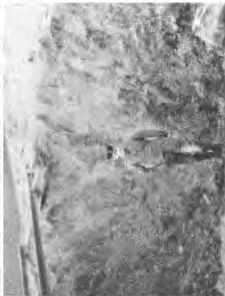
Richter einer 28-cm-Granate.