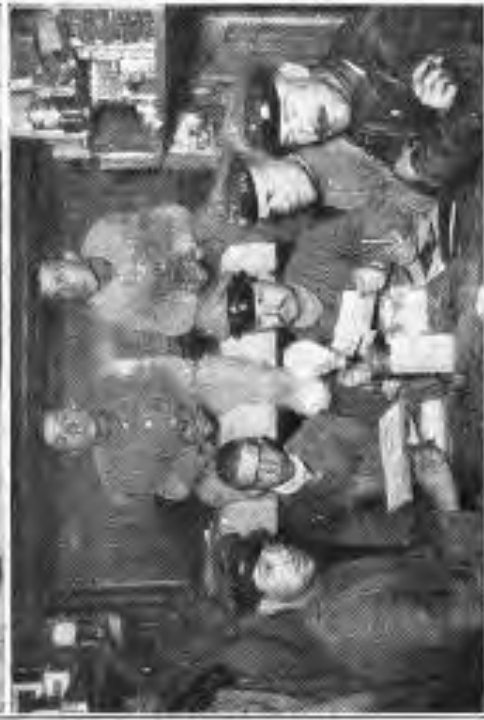
Bild in einen miiertierten Unterfond in der Ghampagne. Vorn »Wohnzimmer«, hinten »Schlafzimmer«.