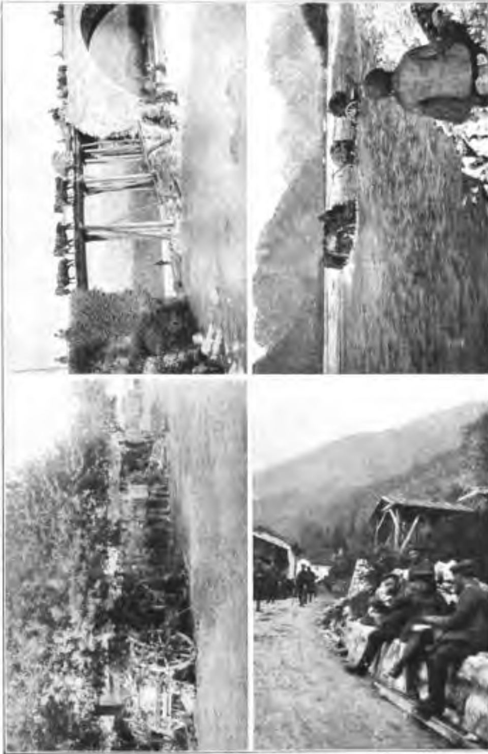
Rast auf dem Bormarisch.