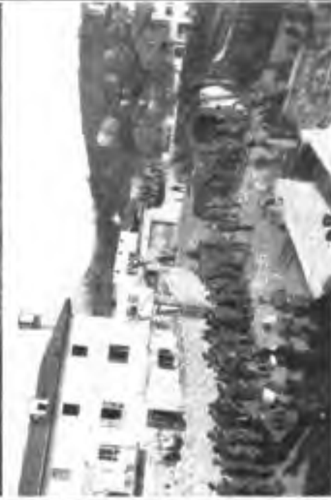
Promenabentag am Kaisergeburtstag in Colfe.