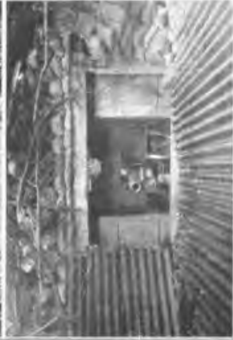
Geschäftsstand in der Champagne mit Westfäl. Vorlage zur Verhinderung von Raucherwiderung beim Schuß. 1916.