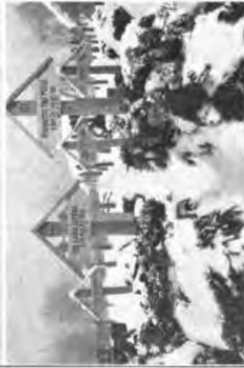
Friedhof in Feltre (Stalien).