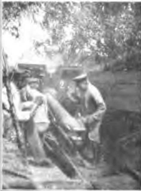
Geschütz im Sperrschneßfeuer an der Somme.