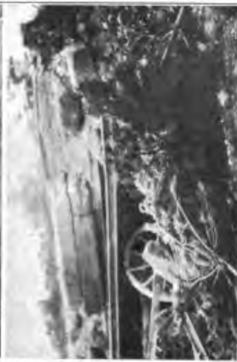
nach der Befestigung.