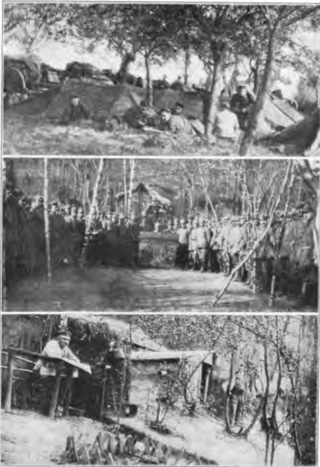
Oben: Bivak auf dem Vormarsch. Mitte: Feldgottesdienst der Kolonne II. Unten: Waldlager der Kolonne II bei Belle Fontaine.