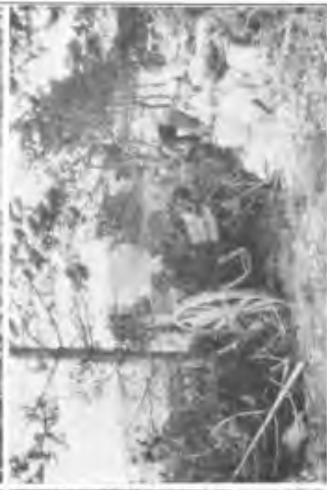
Geschäftsstand bei Verdun nur noch gegen Fliegerflucht geschützt. 1917.