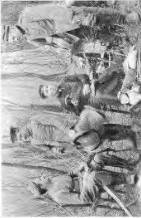
Sandwerferhube im Freien.