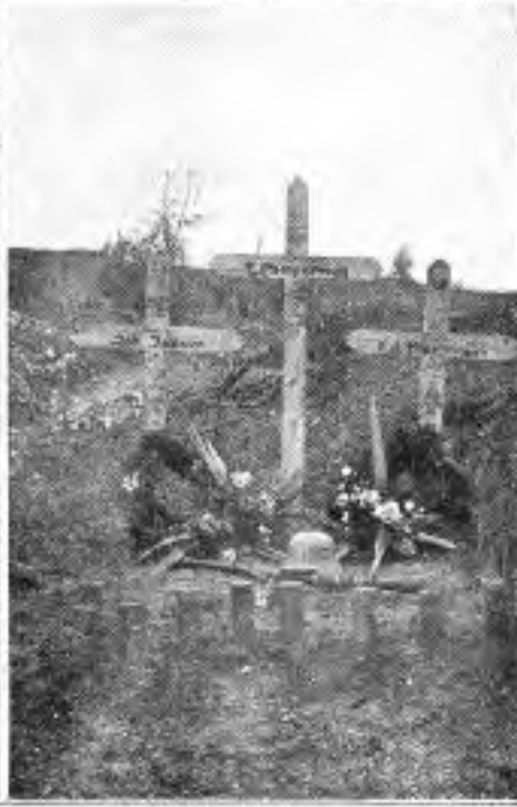
Grab der drei Kriegesfreiwilligen der 6./24 in der vorherigen Inf.-Estellung bei Dorleug (Somme).