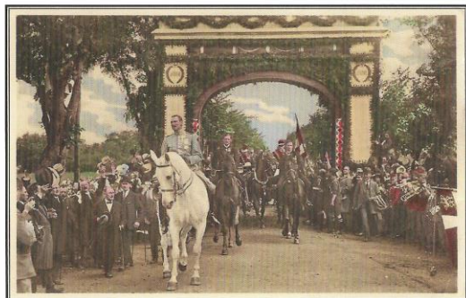
Kong Christian 10. rider over grænsen ved Frederikshøj den 10. juli 1920.

Betaling til Middelfart Sparekasse, reg. 0759 konto 3230490049 Husk at oplyse navn og adresse ved afgivelse af bestillingen.