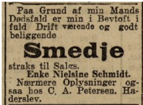
Flensborg Avis den 30 maj 1920