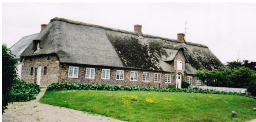
Kristen Koldsvej 2, Mjolden, Skærbæk