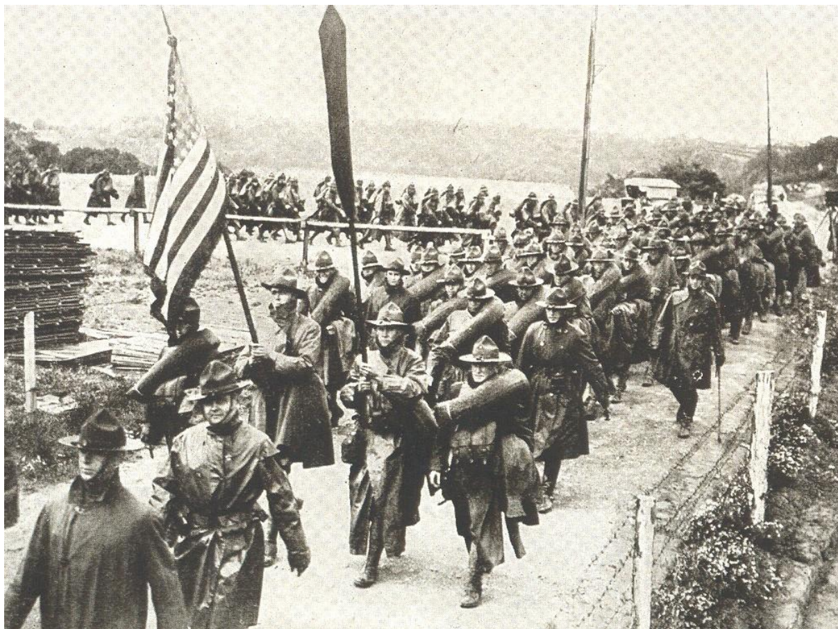
De første amerikanske soldater ankommer til Frankrig 1917.

evne betød de nye, veludrustede, friske tropper derimod et gevaldigt løft.