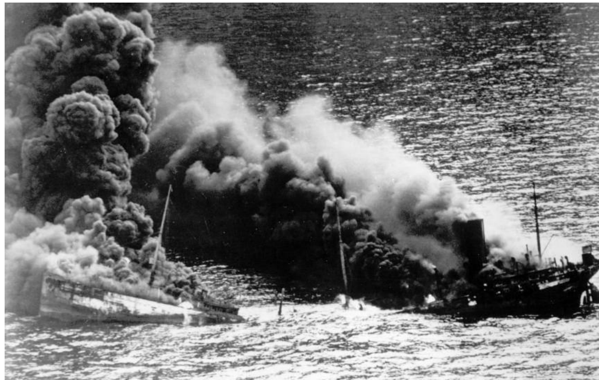
Amerikansk tankskib skudt i brand i Atlanterhavet af tysk u-båd.

Amerikanerne protesterede voldsomt – uden virkning og erklærede derfor 6. april 1917 krig mod Det tyske Rige. Samtidig intensiverede man leverancerne til de nye partnere, Frankrig og England, selv om talrige allierede handelsskibe blev sænket.