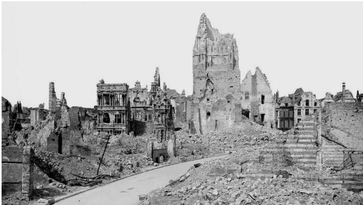
Ruinerne af rådhuset i Arras 26. maj 1917.