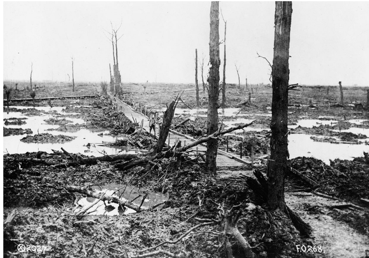
Et ufremkommeligt, flandersk landskab totalt ødelagt af granater.

leret nye, forstærkede forsvarsstillinger med strategisk placerede maskingeværer, og man havde haft tid til at omplacere kanoner, så de var usynlige for fjenden. Desuden fik