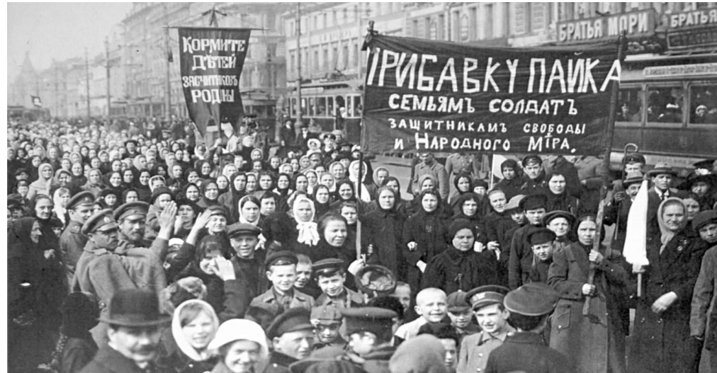
Kvindelige og mandlige demonstranter fra Putilow-Værkerne 23. februar

To store begivenheder kom til at påvirke udviklingen af krigen i 1917: Den russiske revolution, som startede i februar 1917 og USA's indtræden i krigen på den franske/britiske side sidst på året.