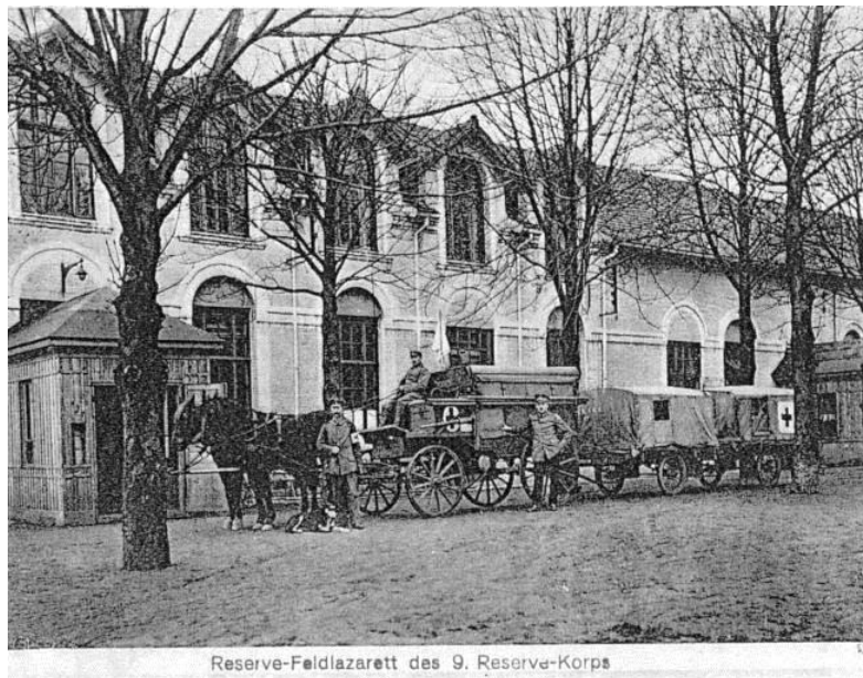
Det ser dog ikke ud til, at han selv er med på fotoet.

første periode blev oppasser for en overlæge. Fra d. 22. januar 1917 blev han overført til Sanitetskompagni 513 som kusk.