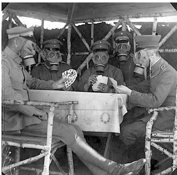
Der spilles "gasmaskeskat".