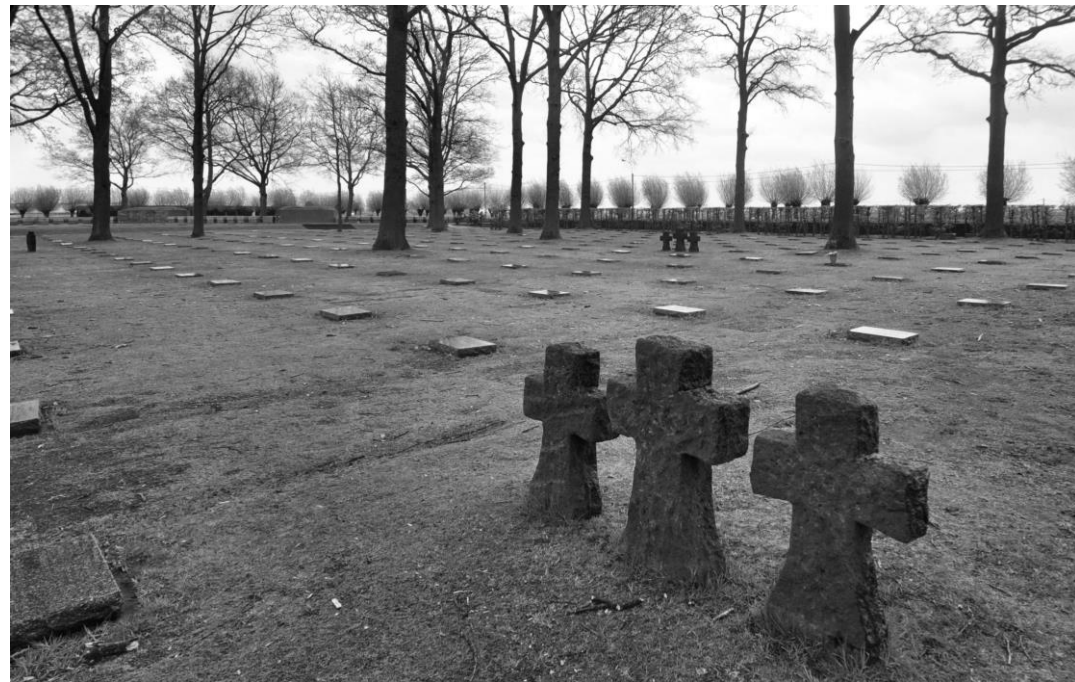
Et lille hjørne af den mægtige tyske krigskirkegård Langemarck i Belgien, privatfoto fra 2012. På hver gravplade står som regel mellem 2 og 10 navne.

givne, tyske soldater begravet her, som alle faldt i Flandern-slagene. I en stor fællesgrav ligger desuden 25.000 ikke identificerede soldater. I en bygning ved indgangen til 'Soldatenfriedhof Langemarck' ligger en bog med navnene på de mange soldater - samt en angivelse af, hvor