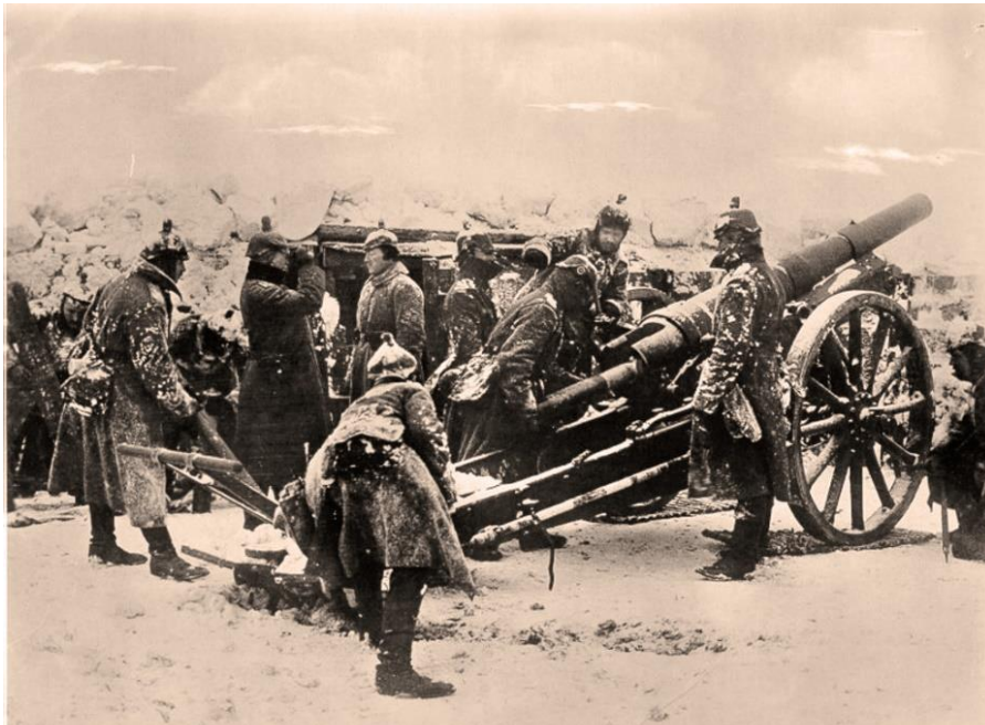
10 cm batteri i kampstilling på Østfronten sidst på året 1915.

Dødsfaldet er indskrevet af personregisterfører 3. februar 1916.