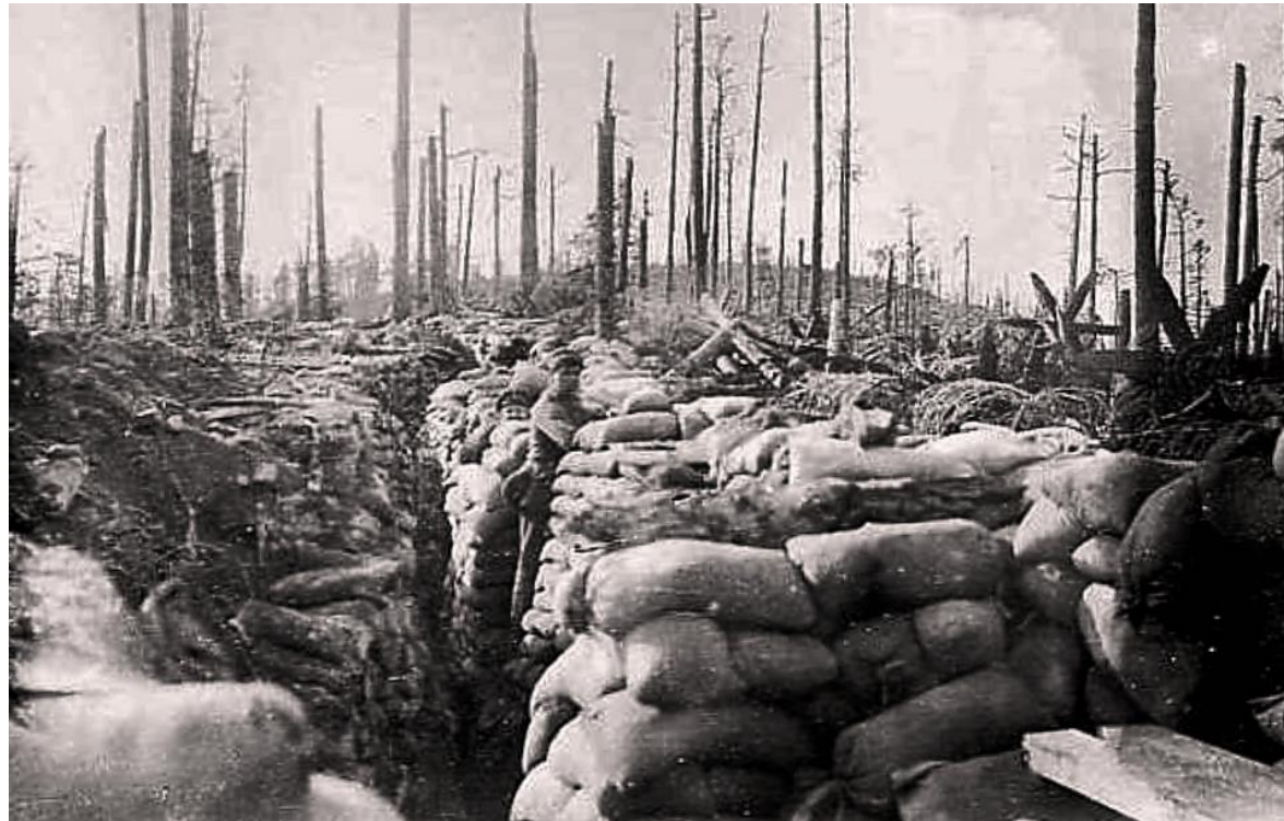
Skyttegrave i Schratzmännle. De nøgne træstammer vidner om, hvor heftige, kampene var.

In den Vogesen versuchten die Franzosen die ihnen am 12. Oktober am Schratzmännle abgenommene Stellung zurückzu- nehmen. An unserem Hindernis brach ihr Angriff nieder.