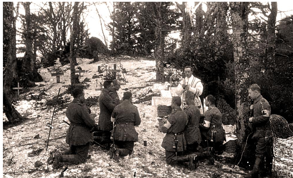
Tysk begravelse af kammerater på Hartmannsweilerkopf i Vogeserne

Bjerget med den tætte nåletræsbevoksning var den 22. januar faldet i tyskeres hænder. Bjerget blev af tyskerne kaldt for "Menschenfresser" eller "Berg des Todes" på grund af tabene, som tyskerne og franskmændene led i kampene i de kraftige bastioner, observationsposterne,