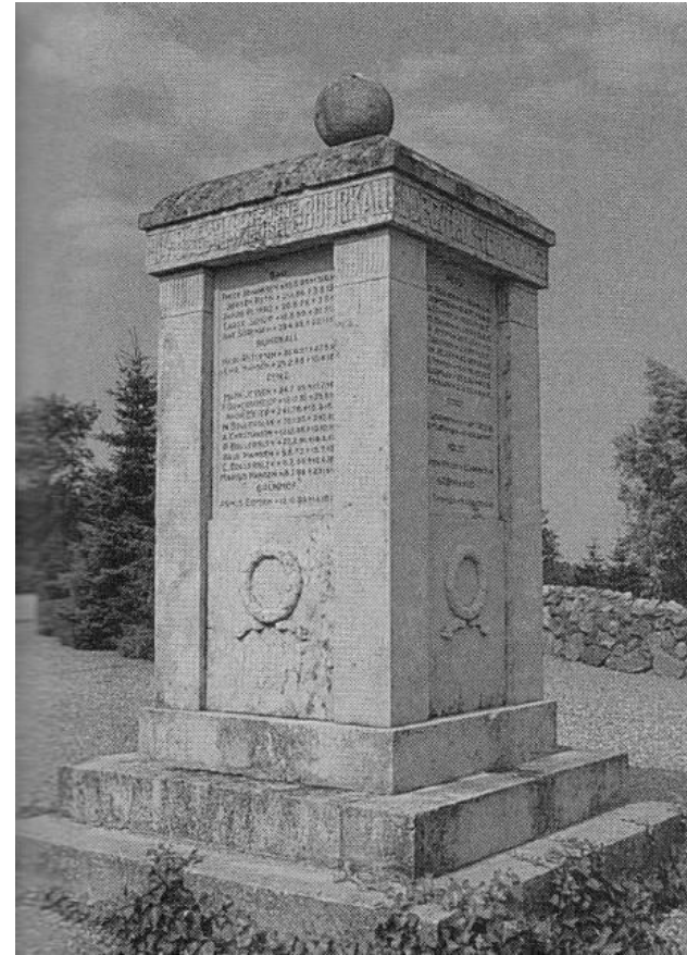
Mindestenen for de faldne i 1. Verdenskrig ved Burkal Kirke, som den så ud kort efter opsætningen, bemærk beplantningen nederst, som mange år efter var ved at "kvæle" stenen.

ring. De kan afleveres på museet, og vi lover hurtig returnering af materialet. På forhånd tak!