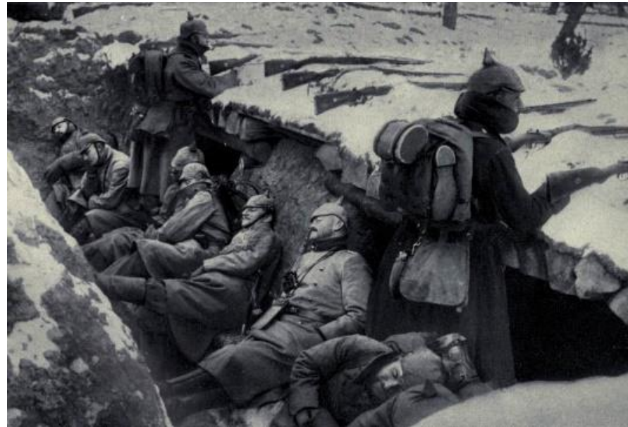
Tyske soldater fryser i en skyttegrav på Østfronten vinteren 1914-15.

Mange af de unge, sønderjyske mænd, som var startet med at kæmpe på Vestfronten, blev sidst på året 1914 sendt til Østfronten.