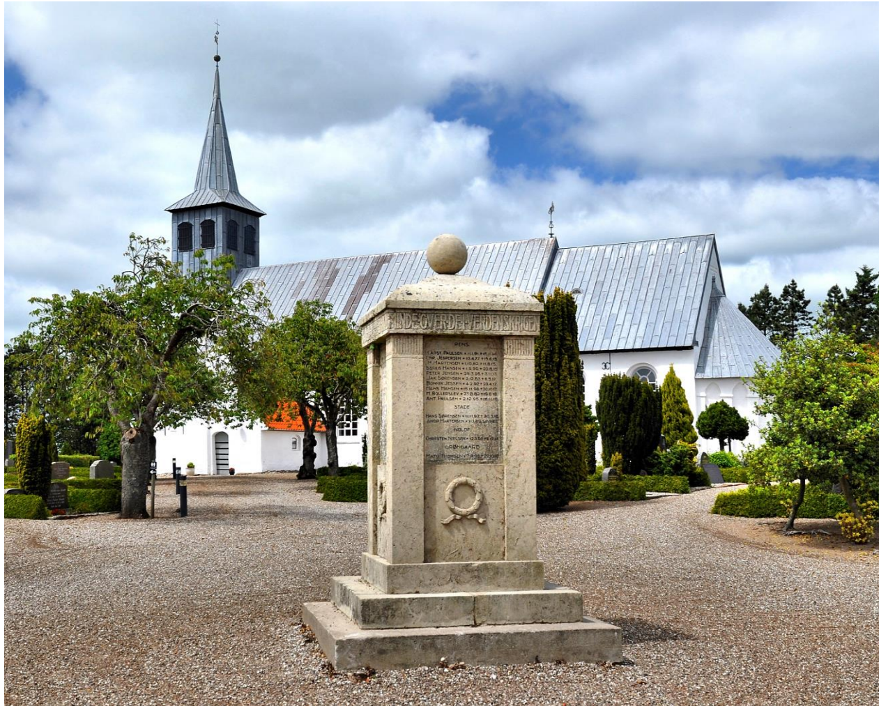
Efter afrensningen af den grønne tilgroning, kan man nu rigtigt beundre den flotte mindesten ved Burkal Kirke, som blev rejst for at mindes sognets faldne i 1. Verdenskrig.