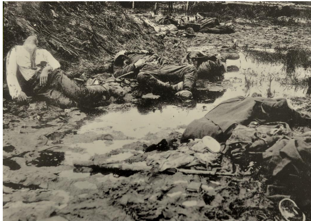
Døde soldater i regnvåd skyttegrav. Privat affotografering af billede i fransk museum.

Hen over vinteren og foråret var skyttegravene forvandlet til ét ælte, hvilket sled på fysikken og nerverne