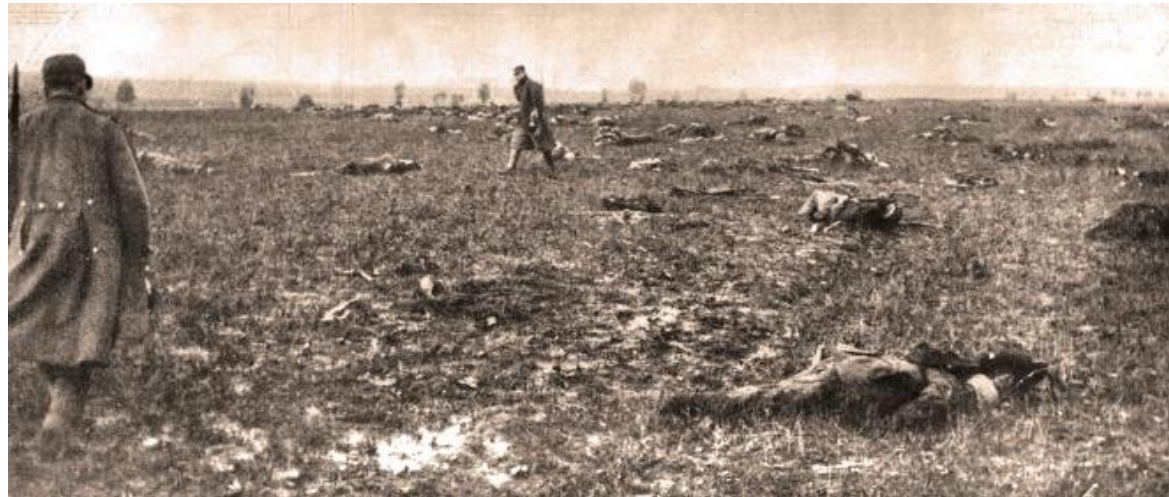
Tyske ofre dækker jorden efter et stormangreb mod franske styrker nær Champagne.