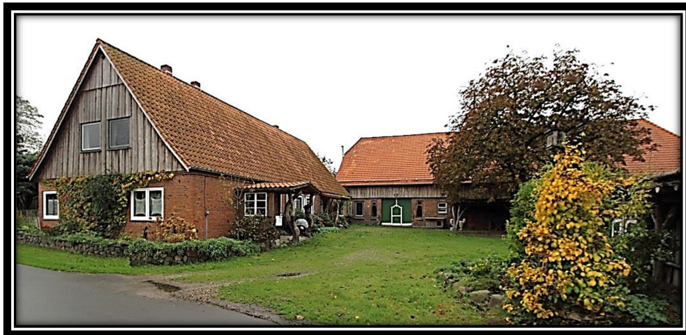
PLEJEFORÆLDRENE'S GÅRD I KRUMMENORT