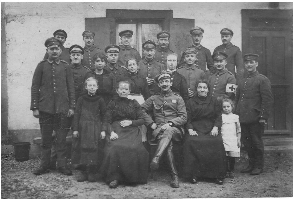
Fotograferet julen 1917.