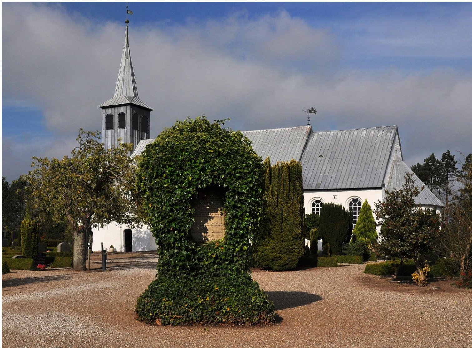
Burkal kirke med mindestenen for de faldne i 1. Verdenskrig i forgrunden.