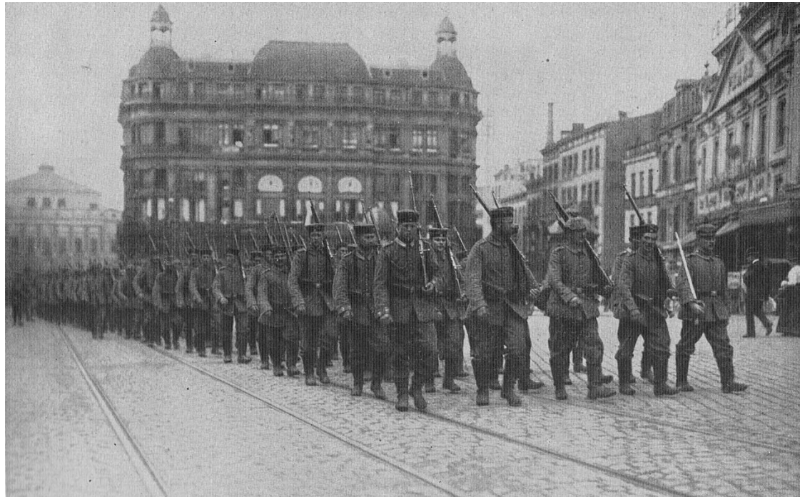
Füsilier-Regiment Nr. 86 marcherer gennem Liege, august 1914. Regimentet, der også blev kaldt Füsilier-Regiment "Königin" (Schleswig-Holsteinsches) Nr. 86, havde hjemsted på Duburg Kaserne, Flensborg (I. og II. Bataillon) og på Sønderborg Slot (III. Bataillon).

på alles vegne. Det var en tung afsked, vi vidste jo ikke, om vi skulle se hinanden mere. Jeg fik lov at tale med ham en ganske kort tid ved kaserneporten.”